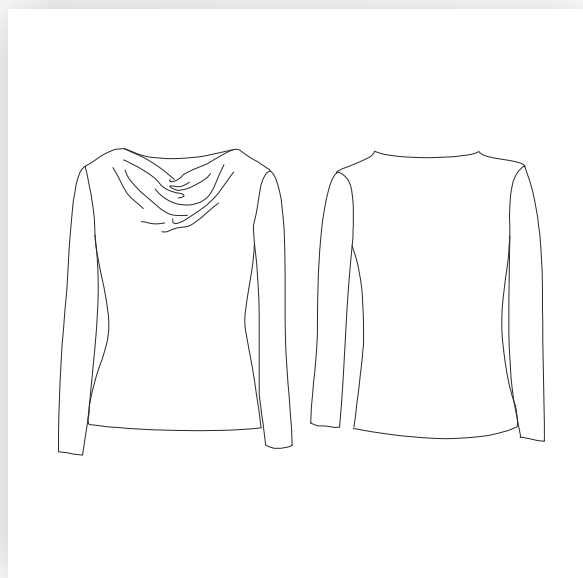
T-Shirt mit Wasserfall Ausschnitt und langen Ärmeln.